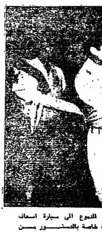
أحد شرطة مكافحة الشغب في مدينةمكسيكو يحمل امرأة أصابها الغاز المسيل للدموع الى سيارة اسعاف